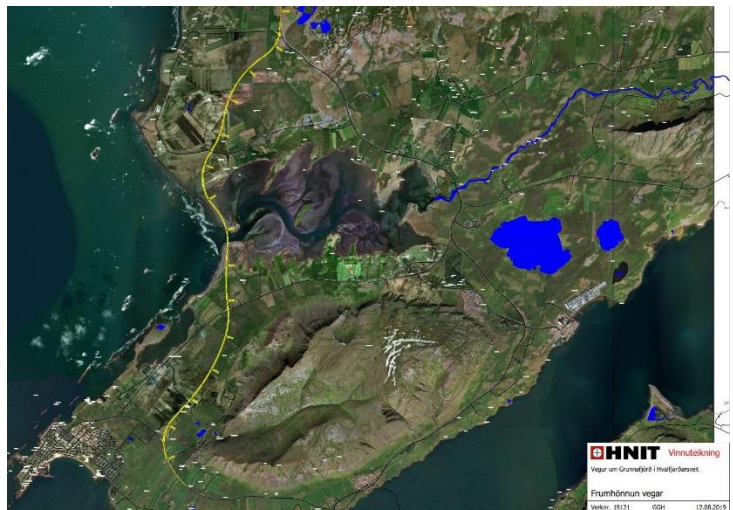
Mynd 1Hugsanleg veglína vegar um Grunnafjörð og í nágrenni samkvæmt uppdrætti unnum afVerkfræðistofunni Hnit 2019. Stærri mynd má nálgast hér ?

Ekki er neinum blöðum um það að fletta að full þörf er að ráðast í þessar framkvæmdir sem allra fyrst í ljósi vaxandi umferðar auk þess sem áform eru uppi um að gera ný Hvalfjarðargöng til viðbótar þeim sem fyrir eru svo og gerð Sundabrautar. Mikilvægt er því að huga sem allra fyrst að sem hagfelldastri legu vegar þessa leið. Í aðalatriðum virðist um tvo kosti að ræða, þ.e. annars vegar veg sem að mestu liggur í núverandi línu og hins vegar veg sem liggur vestur fyrir Akrafjall og þaðan norður yfir mynni Grunnafjarðar og þaðan áfram áleiðis í Borgarnes.